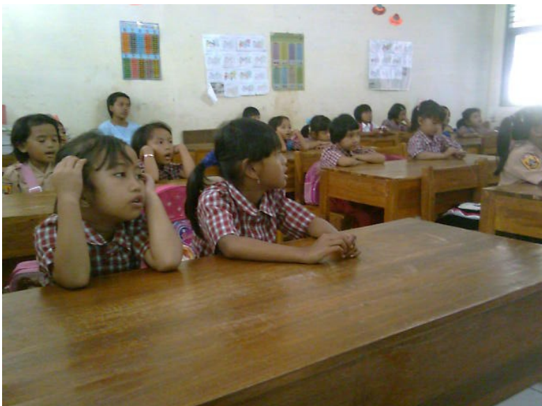
Siswa membeo kata-kata yang dibaca guru.