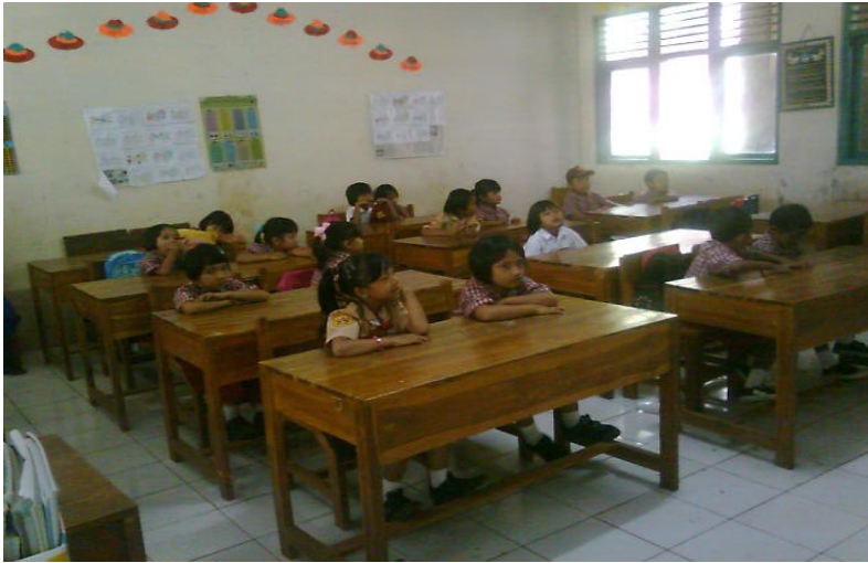
Siswa-siswa mengikuti pelajaran membaca permulaan.