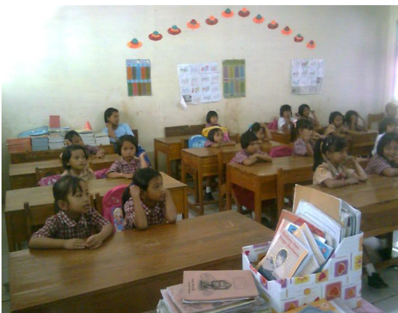
Siswa-siswa mengikuti pelajaran membaca permulaan.