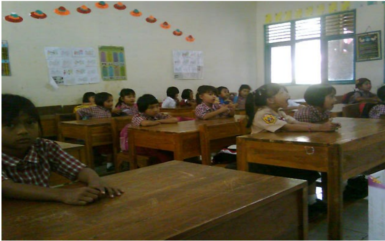
Siswa membeo kata-kata yang dibaca guru.