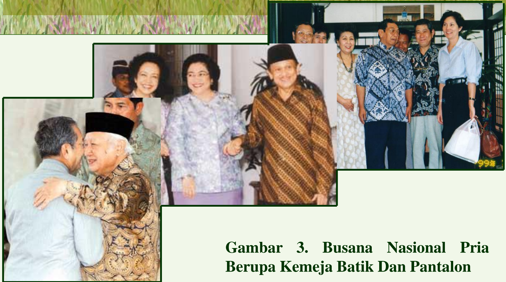
Gambar 3. Busana Nasional Pria Berupa Kemeja Batik Dan Pantalon