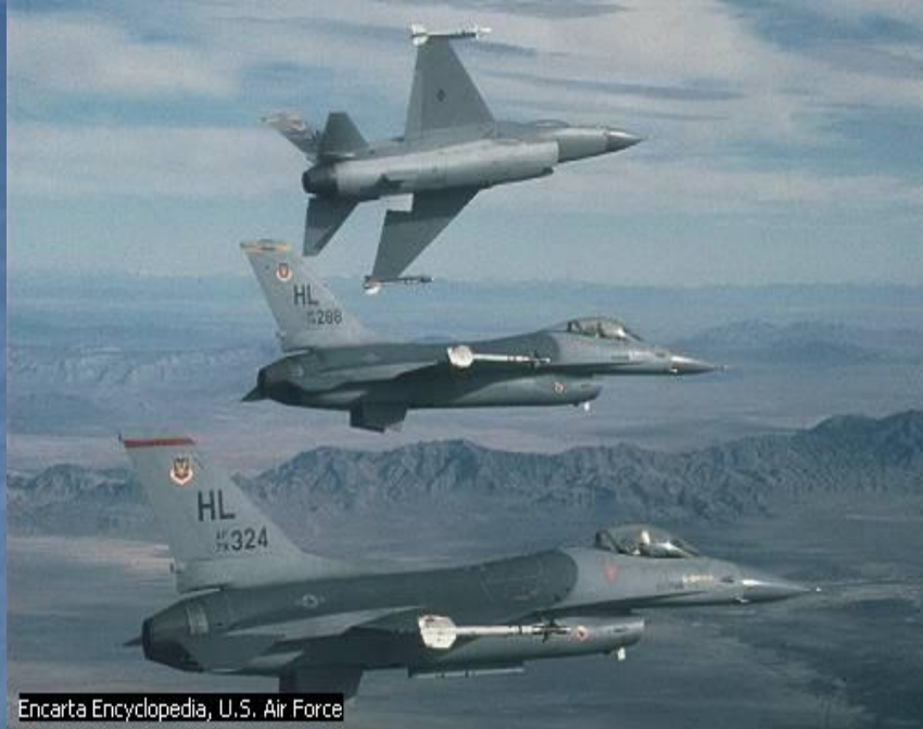
Encarta Encyclopedia, U.S. Air Force