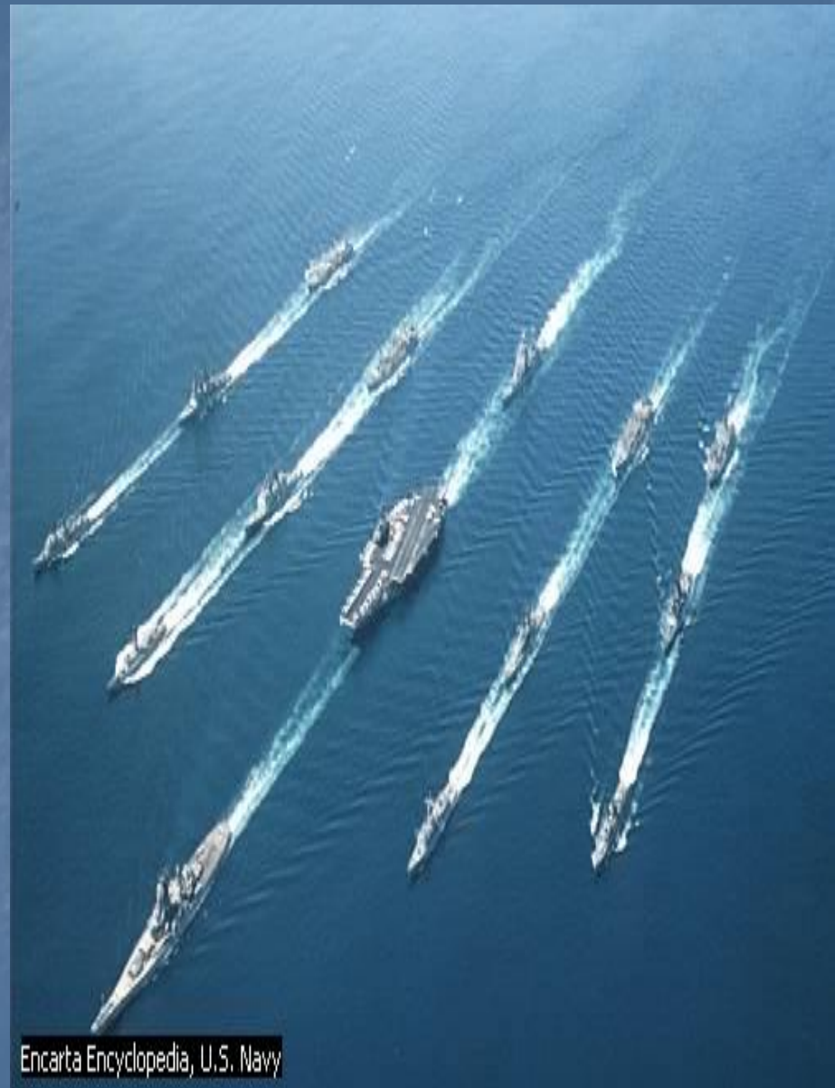
Encarta Encyclopedia, U.S. Navy