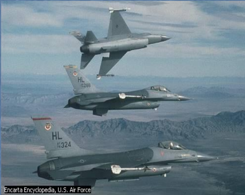
Encarta Encyclopedia, U.S. Air Force