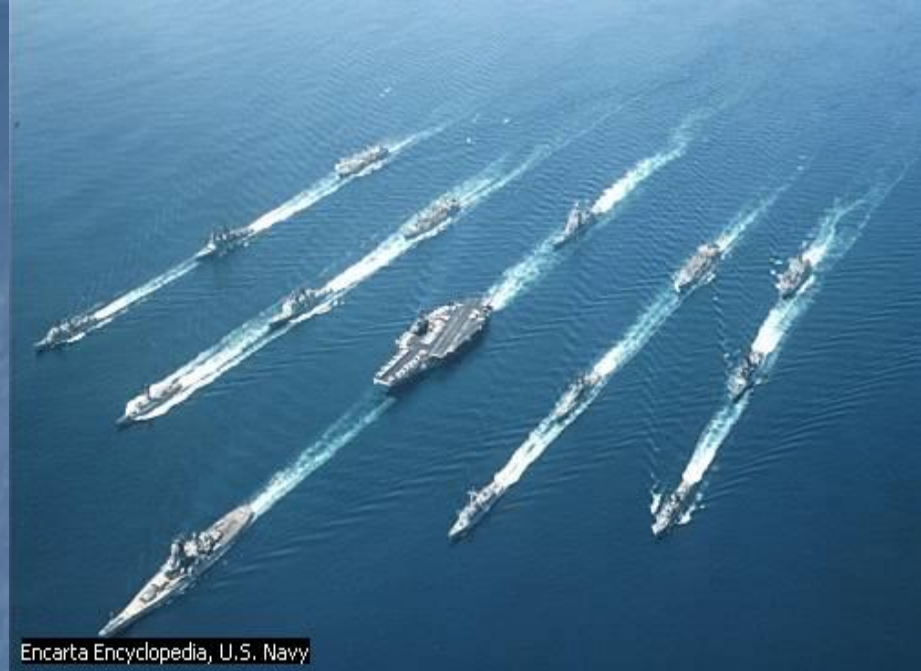
Encarta Encyclopedia, U.S. Navy