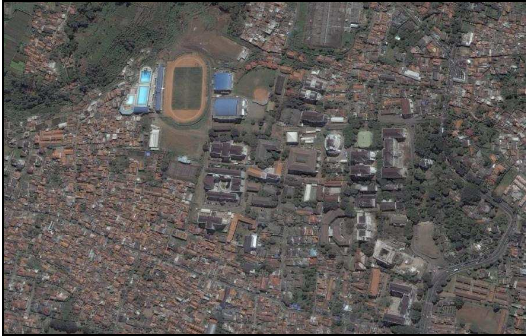
Gambar 3 Citra Satelit Quickbird Tahun 2007 Kampus UPI Bandung