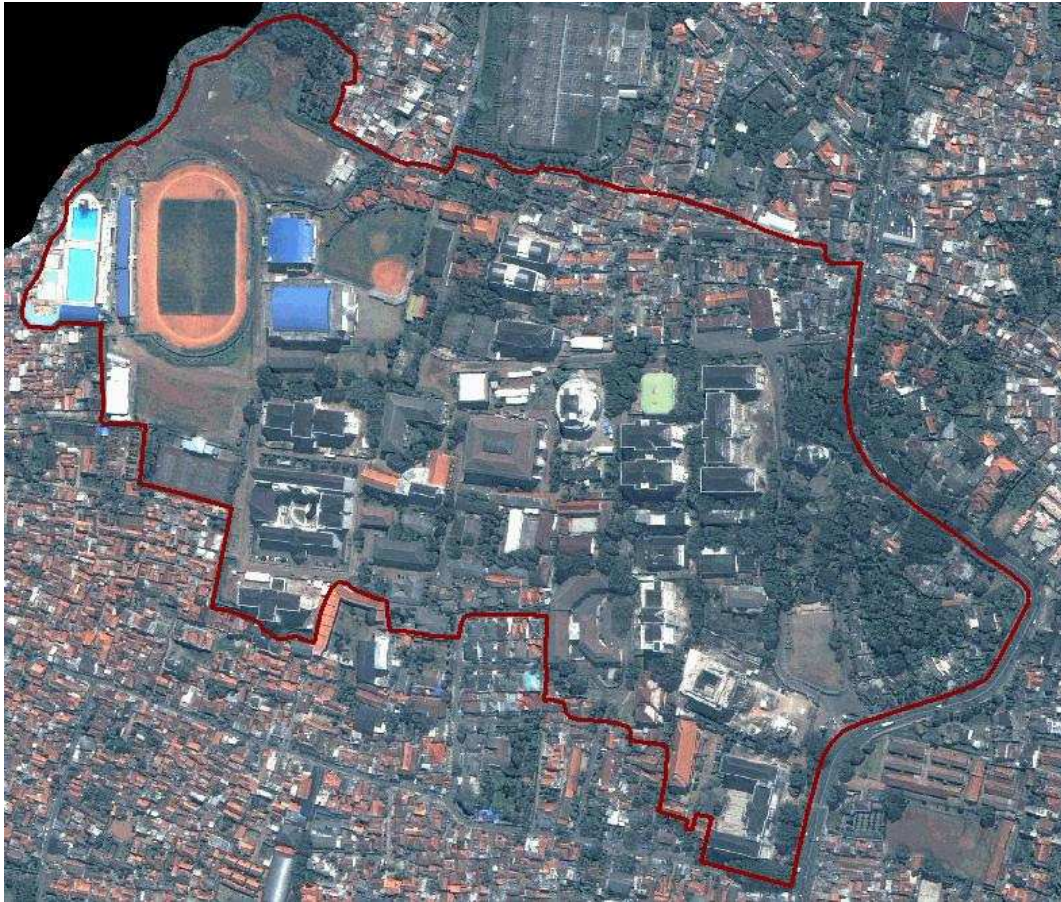
Gambar 4 Batas Wilayah Kampus UPI