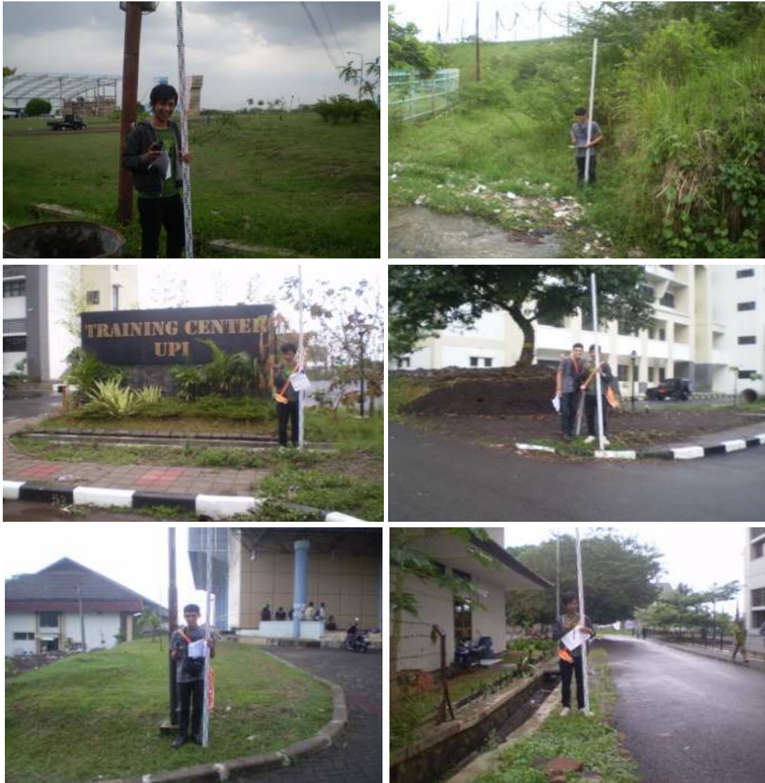
Gambar 6 Kegiatan Pengecekan Posisi Titik Kerangka Dasar