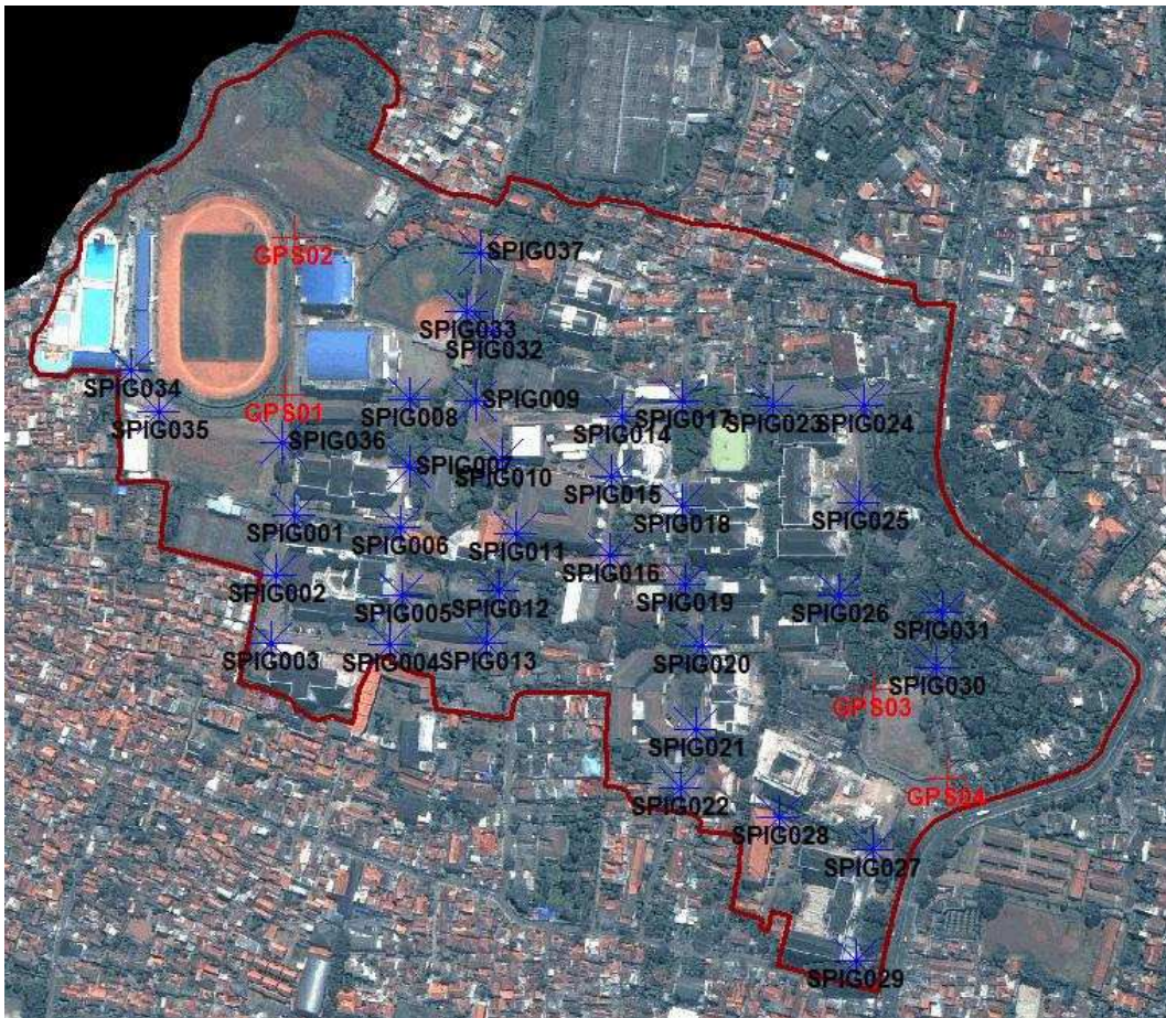
Gambar 5 Desain Awal Sebaran Titik Kerangka Dasar