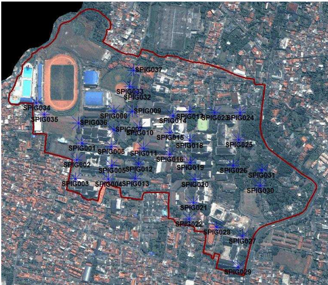
Gambar 8 Sebaran Titik KDH dan KDV