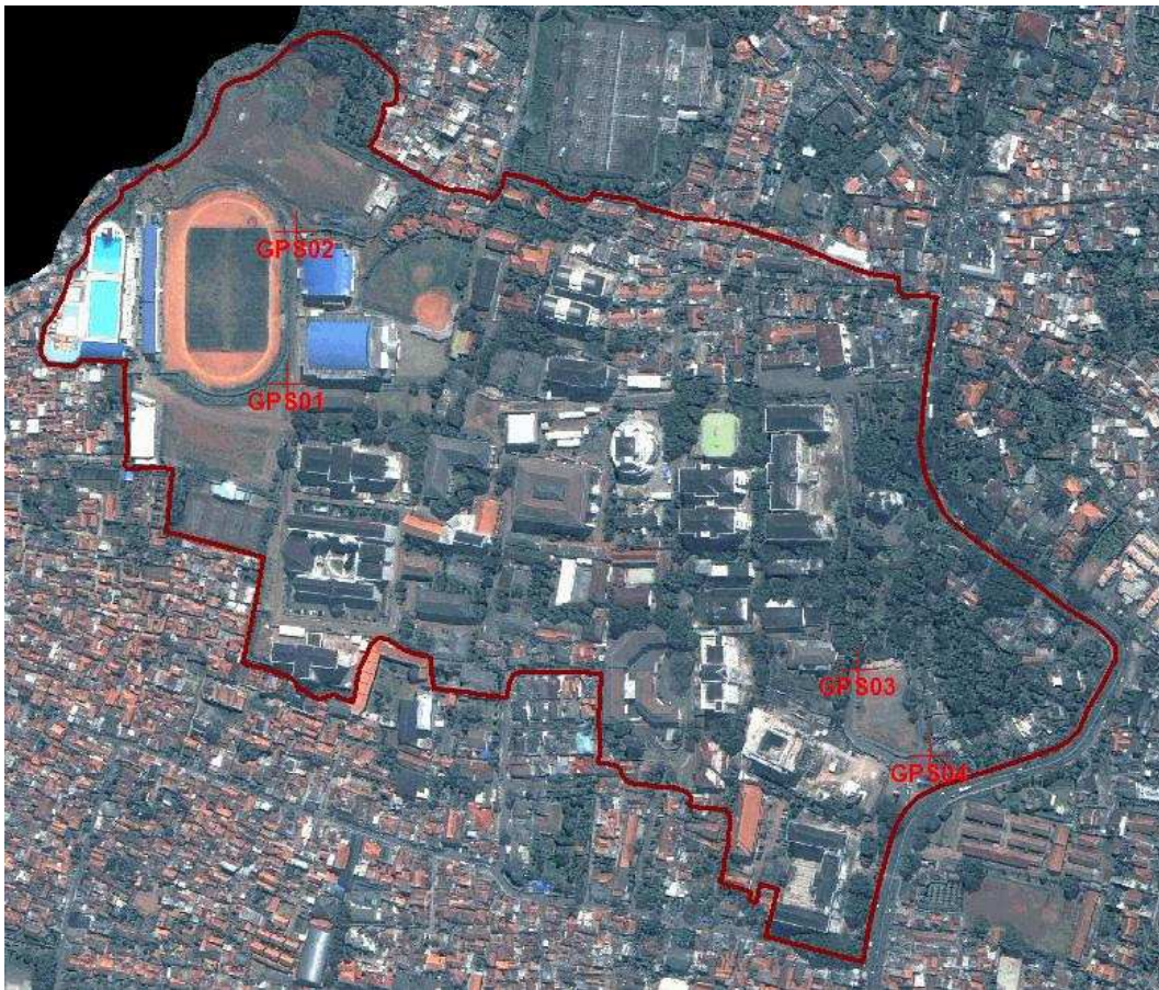
Gambar 7 Sebaran Titik Kontrol GPS