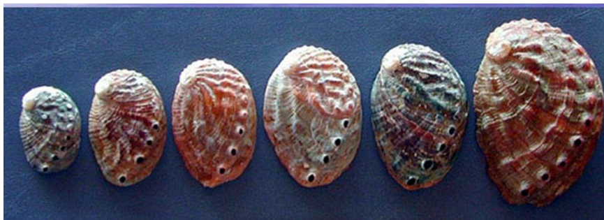
Ilustrasi 4.27: Jenis Kerang Mata Tujuh ( Abalone) 1