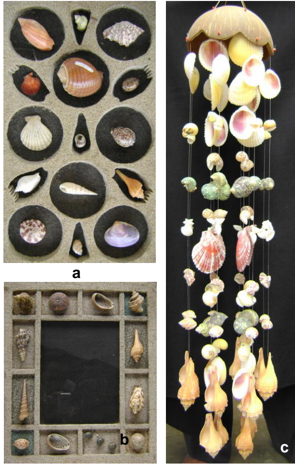
Ilustrasi 4.29: Contoh produk yang masal perajin kerang Pangandaran