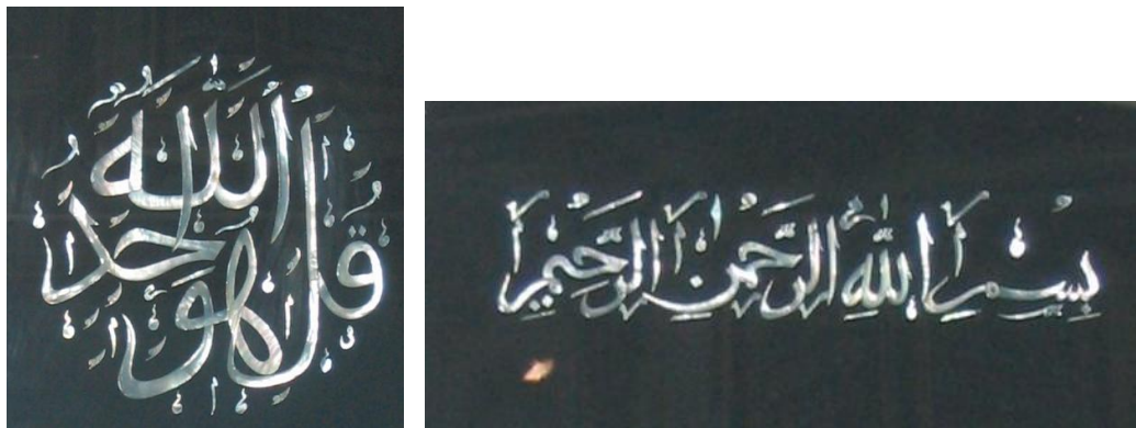
Ilustrasi 4.35: Kaligrafi terbuat dari kulit kerang mutiara

Sisik Ikan Tuna yang dikeringkan dapat dirangkai menjadi bunga kering