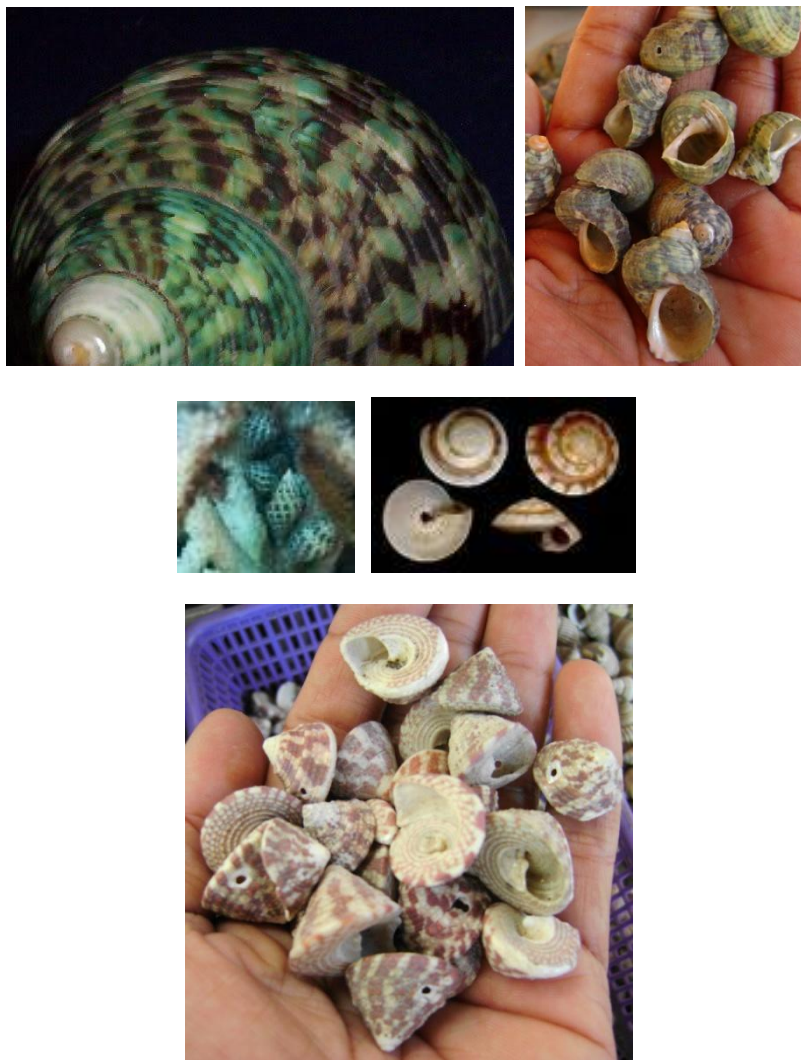
Ilustrasi 4.25: Jenis kerang snails yang hidup di sela-sela Acropora (atas kiri), Jenis Porites coral (kanan dan bawah)