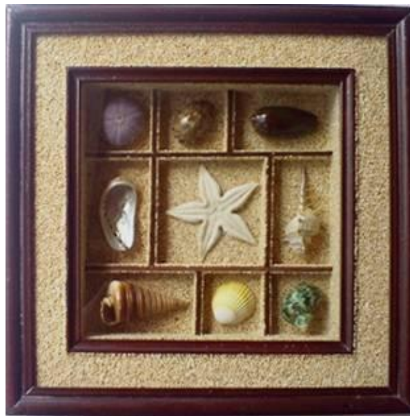
Ilustrasi 4.30: Contoh penampilan frame produk yang masal perajin kerang Pangandaran