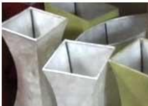
Simping yang dapat dibentuk untuk kap lampu hias