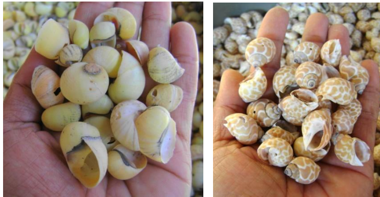
Ilustrasi 4.24: Keong 'escargot' ( Babylonia )