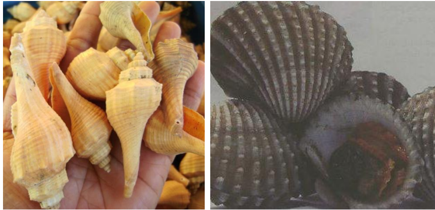
Ilustrasi 4.26: Keong'bako' ( hemifusus ternatanus ) dan Jenis kerang ( Bivalvia )/Tiram