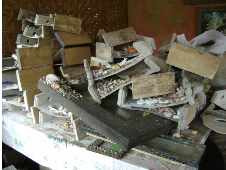
Ilustrasi 4.31: Contoh produk yang kurang memperhatikan aspek konsep desain yang baik

Jenis kerang ini memiliki potensi untuk dibentuk menjadi berbagai alternatif bentuk desain seperti di bawah ini.