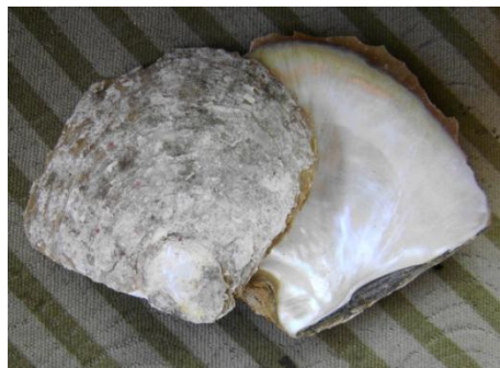
Ilustrasi 4.32: Jenis tiram mutiara ( Pinctada margaritifera dan Pinctada mertinsis )