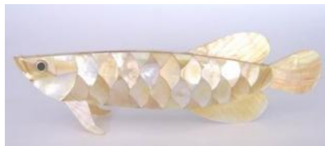
Bentuk ikan arwana yang dibuat dari lapisan kerang mutiara