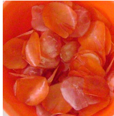
Ilustrasi 4.36 Sisik Ikan Tuna dan Pewarnaannya