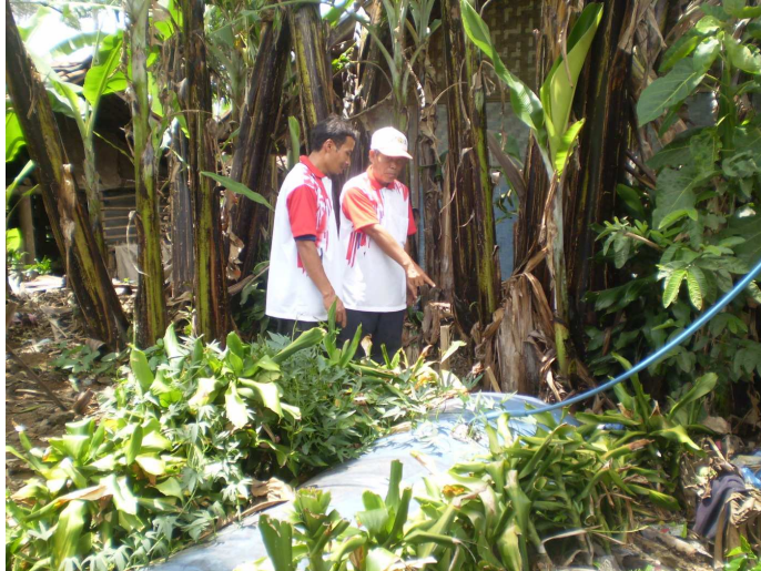
Gambar 4 Instalasi Reaktor Biogas