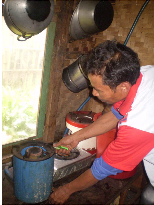
Gambar 7 Pengoperasian Kompor Biogas