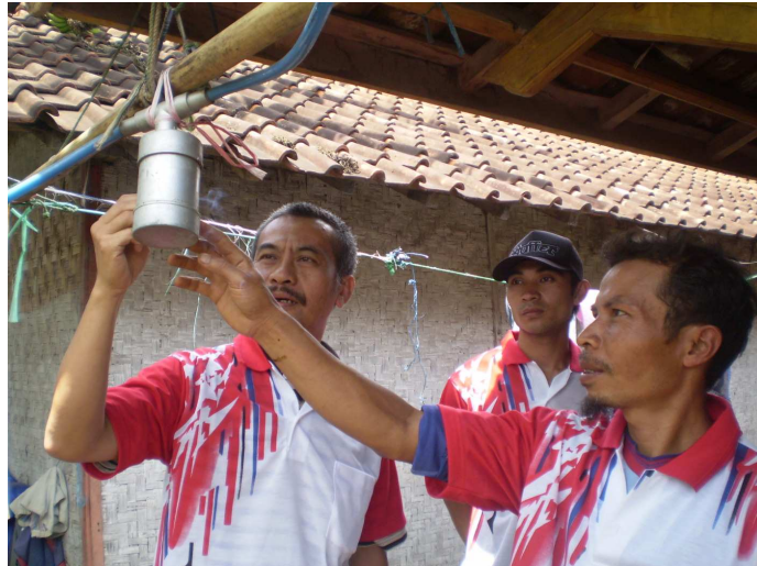
Gambar 8 Klep Pengaman Gas Sebelum Masuk ke Tabung Penampung Gas