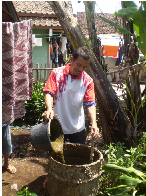
Gambar 5 Proses Pencampuran Kotoran Ternak dan Air