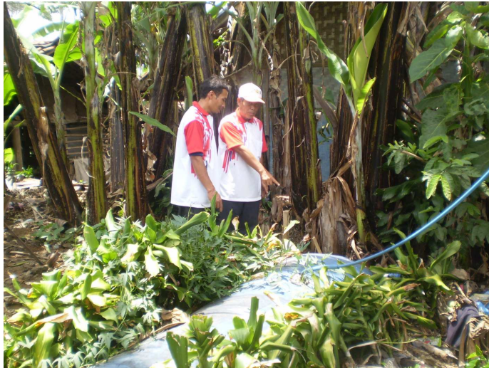
Gambar 4 Instalasi Reaktor Biogas