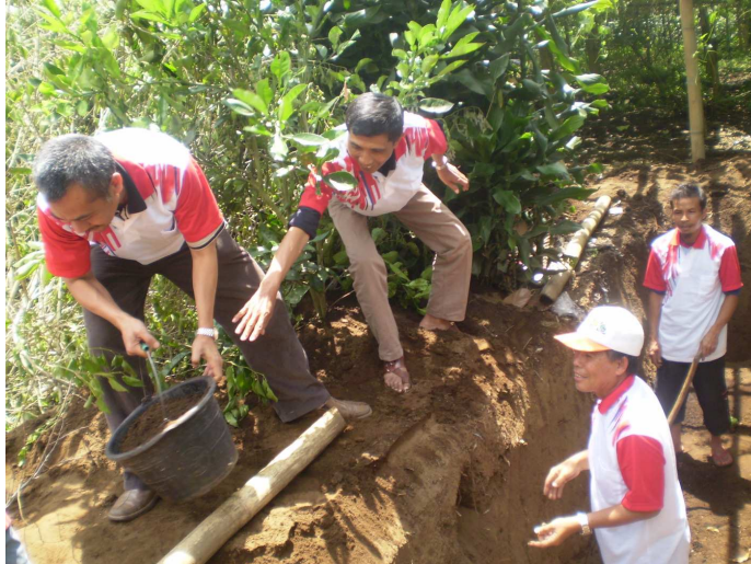
Gambar 3 Pembuatan Lubang Reaktor