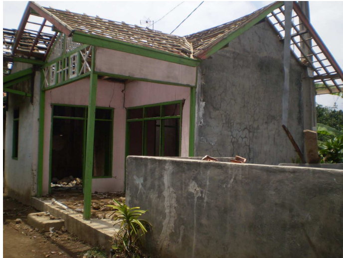
Gambar 9 Keadaan Rumah Penduduk di Kampung Parabon Pasca Gempa Bumi

Penggunaan kotoran ternak sebagai bahan masukan pembuatan biogas tidak serta merta didukung sepenuhnya oleh masyarakat di Kampung Parabon. Hal ini disebabkan oleh budaya masyarakat yang cenderung malas untuk mengumpulkan kotoran ternak. Bahkan seringkali kotoran ternak dibuang begitu saja dan mengalirkannya ke Situ Cileunca. Tentu saja kondisi ini menyebabkan lingkungan menjadi tercemar dan semakin tidak nyaman.