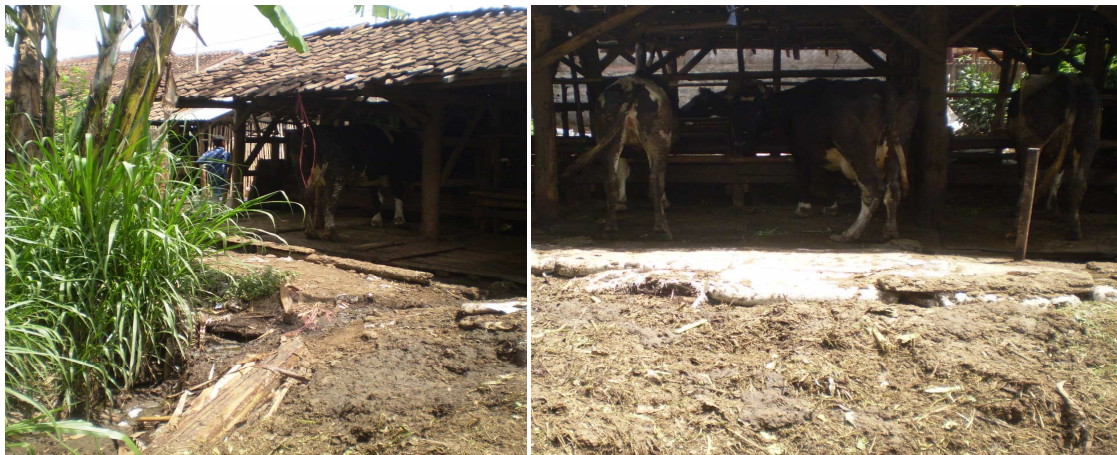
Gambar 10 Kondisi Kotoran Ternak yang Mencemari Lingkungan

Penggunaan kotoran ternak sebagai bahan masukan pembuatan biogas tidak serta merta didukung sepenuhnya oleh masyarakat di Kampung Parabon. Hal ini disebabkan oleh budaya masyarakat yang cenderung malas untuk mengumpulkan kotoran ternak. Bahkan seringkali kotoran ternak dibuang begitu saja dan mengalirkannya ke Situ Cileunca. Tentu saja kondisi ini menyebabkan lingkungan menjadi tercemar dan semakin tidak nyaman.