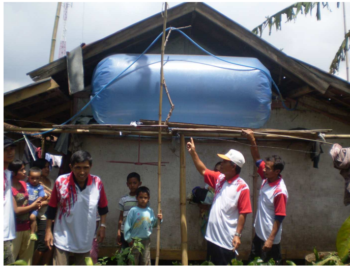
Gambar 6 Penampung Biogas sudah Terlihat Mengembung dan Mengeras