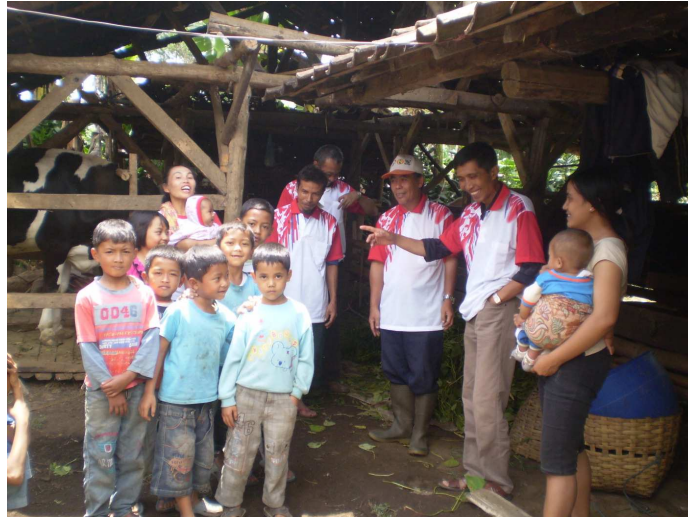
Gambar 1 Penyampaian Materi kepada Para Kader di Kampung Parabon

Khalayak sasaran yang strategis dalam kegiatan ini adalah para kader di kampung Parabon. Materi tentang peranan dan cara pembuatan biogas disampaikan kepada 10 orang kader di Kampung Parabon. Setelah program sosialisasi dan pelatihan pemanfaatan biogas skala rumah tangga dilaksanakan, para kader ini bertugas untuk membina dan meneruskan pendampingan kepada seluruh masyarakat di kampung Parabon.