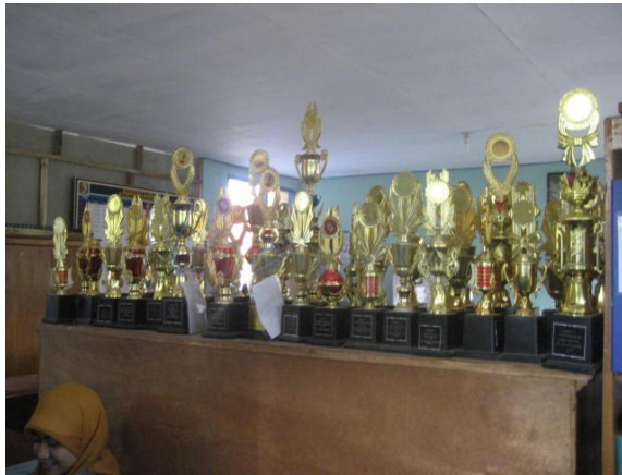
Piala penghargaan hasil prestasi siswa