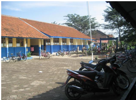
Keadaan lingkungan sekolah