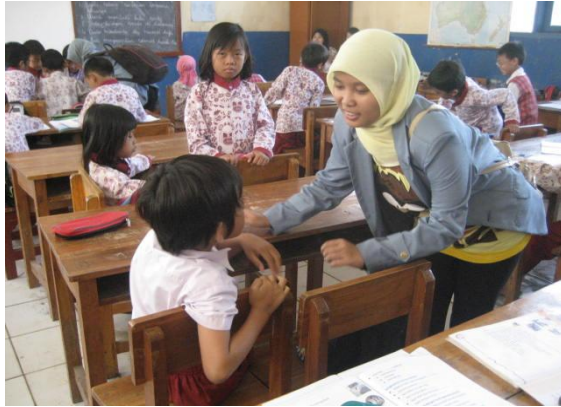
Suasana di kelas