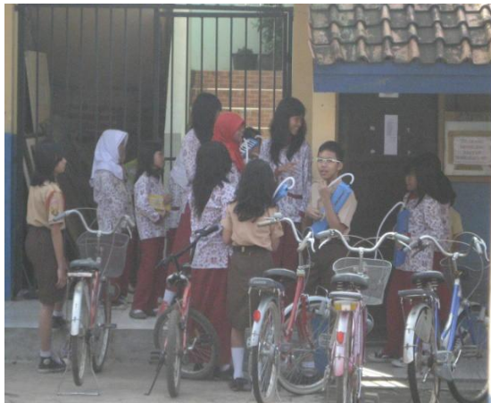
Hubungan sosialisasi antar siswa