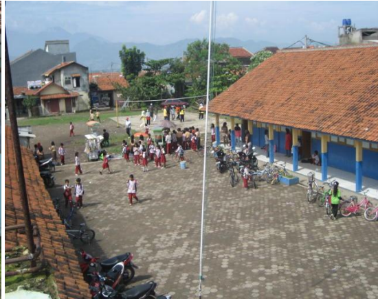
Suasana sekolah saat jam istirahat