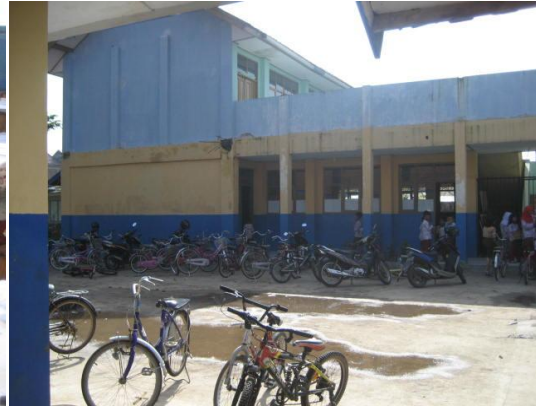
Lapangan sekolah yang dijadikan tempat parkir