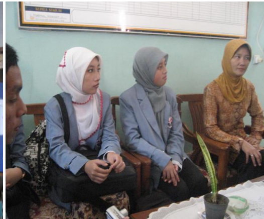
Suasana wawancara dengan pihak Sekolah