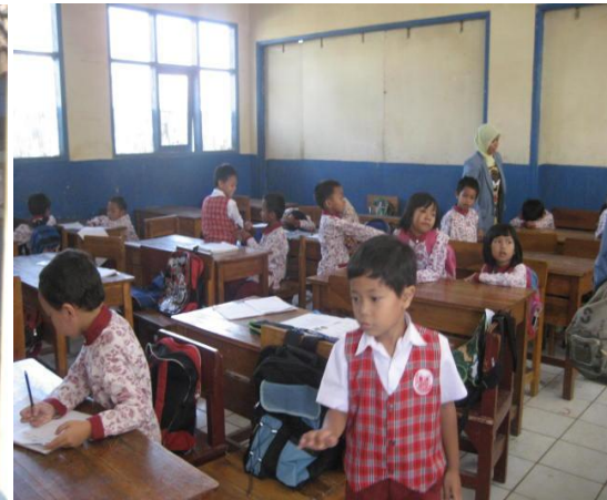
Suasana belajar di kelas