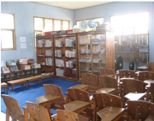
Kadaan perpustakaan sekolah