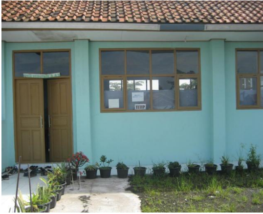
Halaman depan perpus