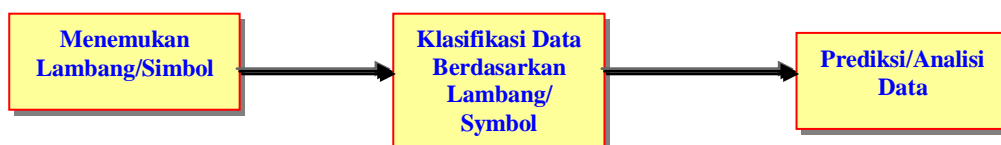
Gambar Analisi Content (Burhan Bungin : 2003)

Contoh analisis data yang dipergunakan seperti model Content Analisis , yang mencakup kegiatan klarifikasi lambang-lambang yang dipakai dalam komunikasi, menggunakan kriteria-kriteria dalam klarifikasi, dan menggunakan teknik analisis dalam memprediksikan. Adapun kegiatan yang dijalankan dalam proses analisis ini meliputi : (1) menetapkan lambang-lambang tertentu, (2) klasifikasi data berdasarkan lambang/symbol dan, (3) melakukan prediksi atas data.